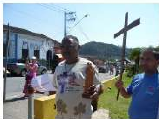
Caminhada pela PAZ.