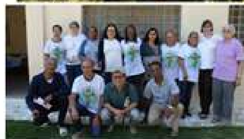
Encontro formativo 2016 em Garça, SP