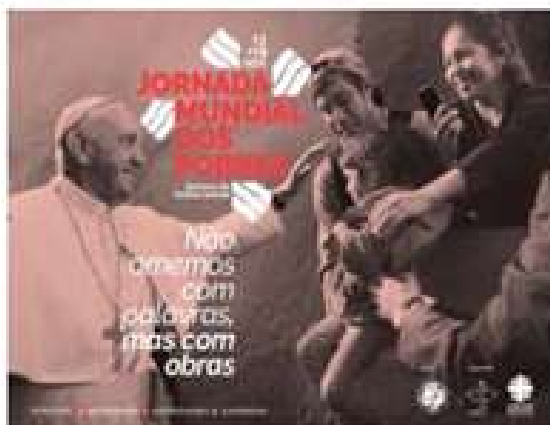
Participação na ação Diocesana, Santo André