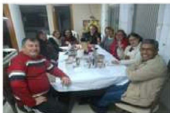
Dionísio Cerqueira, SC