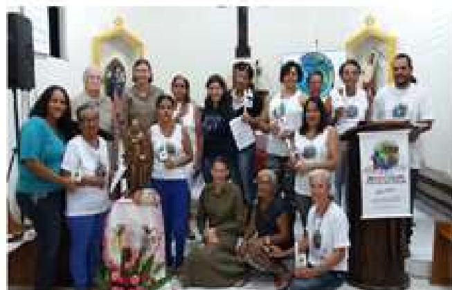
Nova Redenção, BA