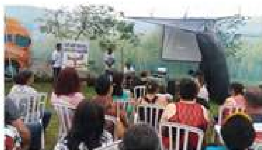
Missa Campal - Ecologia. Fórum Social e Sementes do Reino.