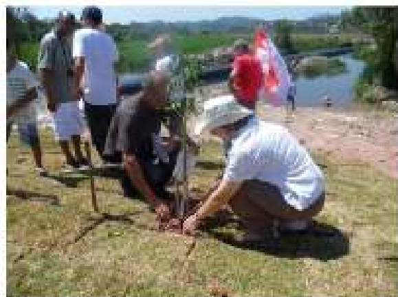
Cuidado com o Meio Ambiente