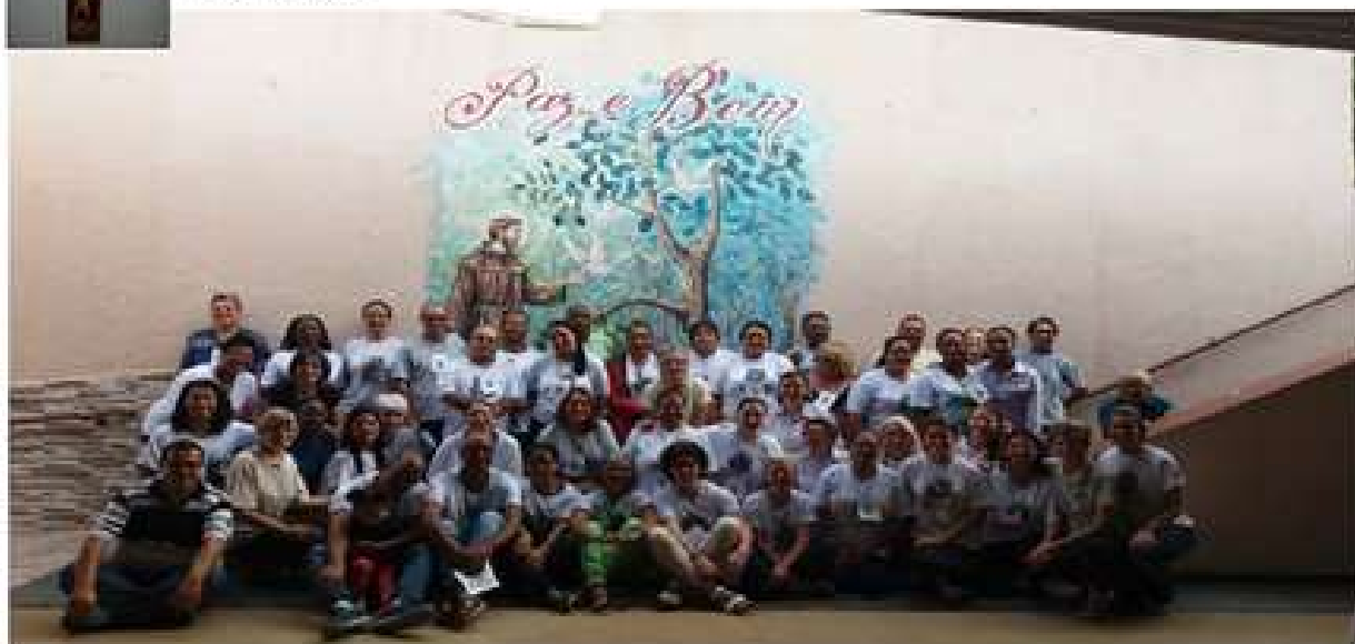
Encontro nacional – 2018 em Rio Grande da Serra, SP