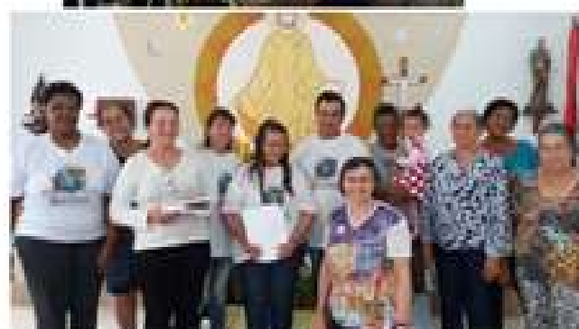
Bairro São Pedro - Chapecó, SC