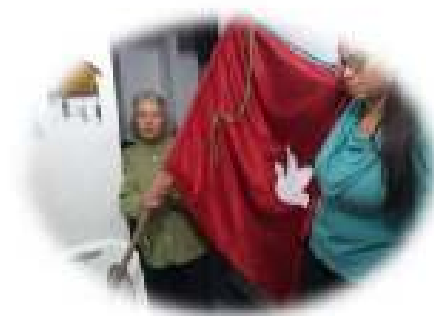
Celebrações nas Comunidades.