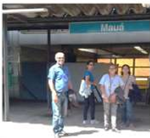
Colaboração com Projeto Horta Comunitária, com pessoas portadoras de transtorno mentais.