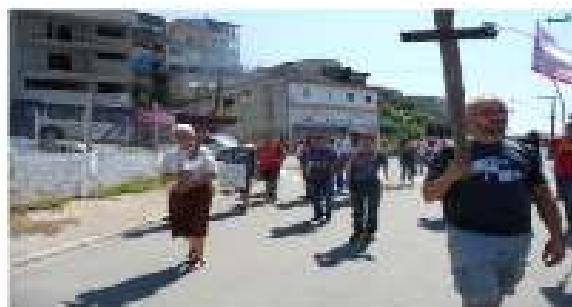
Caminhada em Defesa da Água, Meio Ambiente.