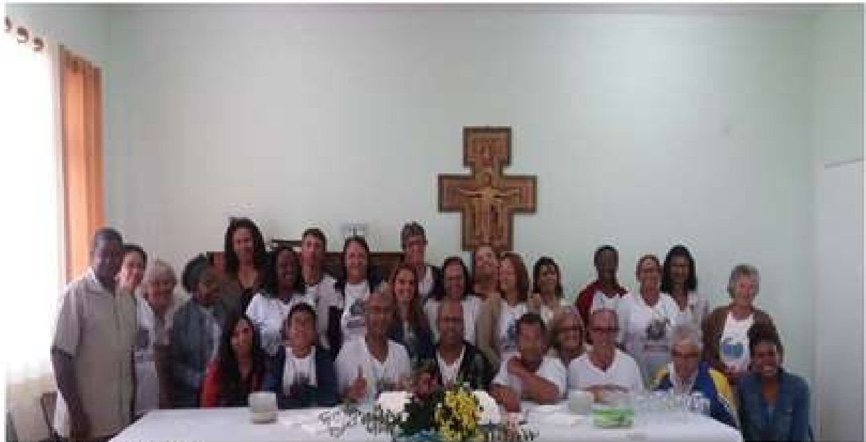
Rio Grande da Serra, SP