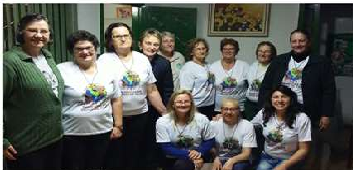
Campo Eré, SC