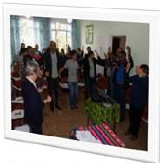
Dia de retiro e formação Franciscana, 2015.